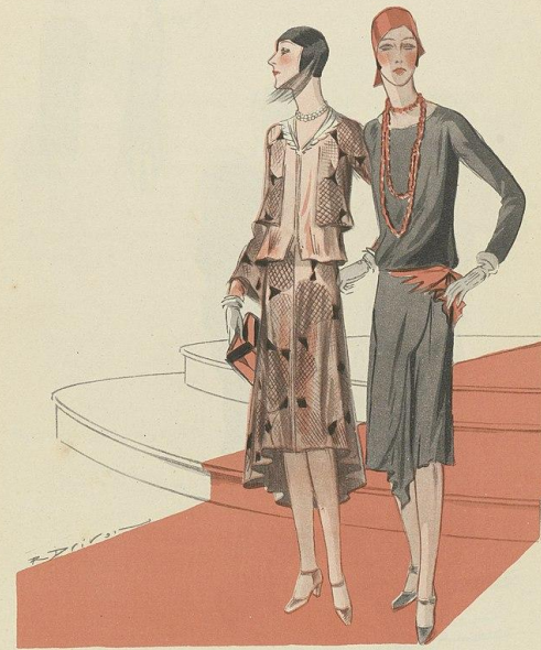
MIRAMAR. — Crêpe imprimé. Paul Poiret.