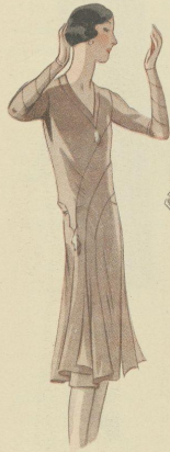
Crépe satin Milwaukee A. G. B. Joseph Paquin.