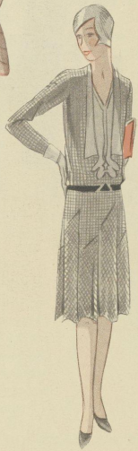
PROBOSCIC. — Crépe imprimé. Premet.